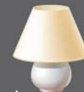
lampade e lampadari