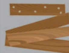
scarti di legno e ferro