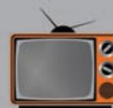
televisori, computer e stampanti