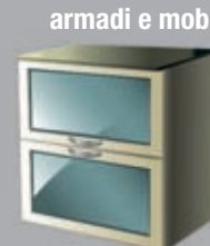
armadi e mobili