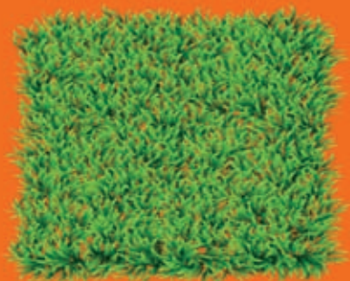
erba del giardino