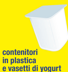
contenitori in plastica e vasetti di yogurt