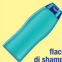
flaconi di shampoo e bagnoschiama