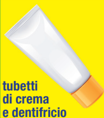
tubetti di crema e dentifricio