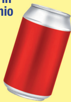
lattine in alluminio