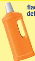
flaconi di detersivo