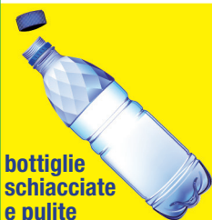
bottiglie schiacciate e pulite