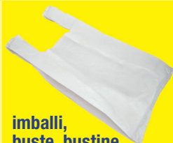
imballi, buste, bustine e borse in plastica