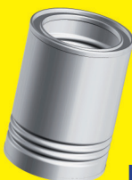
lattine in acciaio