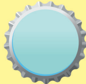
tappi metallici e tappi a corona