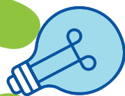
LAMPADINE A FLUORESCENZA